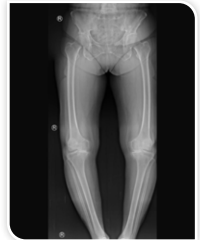
التصوير بالأفلام الطويلة