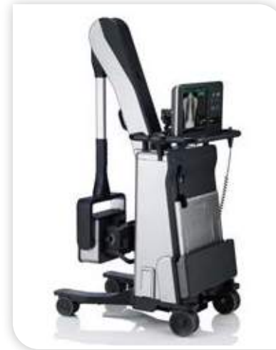
جهاز متحرك للتصوير بالأشعة السينية الرقمية